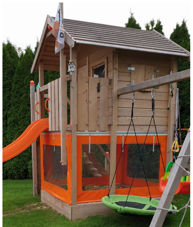
Sonderanfertigung für Spielturm abgestimmt auf bestehendes Farbschema.

Durch den Einsatz unterschiedlicher textiler Materialien und moderner Verarbeitungstechnik, können viele Sonderlösungen und Probleme kreiert werden. Wir bieten Ihnen über 130 Jahre an Erfahrung im Bereich maßgeschneiderter Planen und Sonderlösungen.